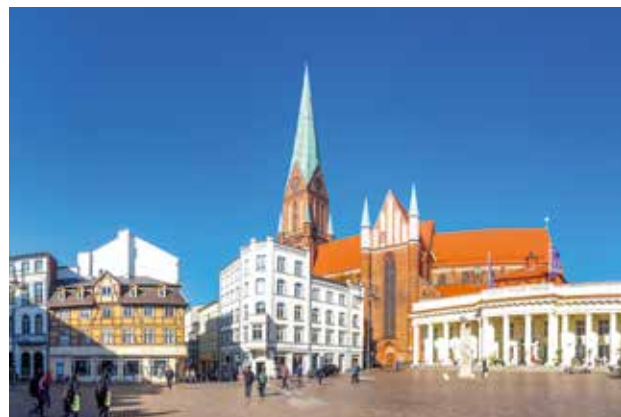
» Schweriner Dom