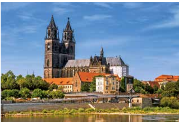
» Magdeburger Dom