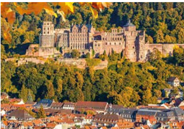
» Schloss Heidelberg