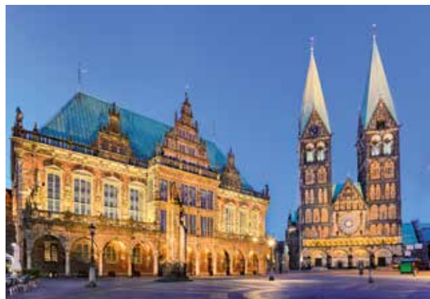
» Rathaus Bremen