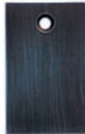
Mssa: Messing schwarz verzinkt / abgerieben