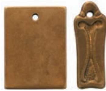
Msa: Messing alt, Oberfläche stumpf