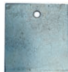
FeZi: Eisen verzinkt FeZiF: Eisen feuerverzinkt