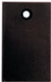
Mss: Messing schwarz verzinkt Fes: Eisen schwarz, pulverbeschichtet