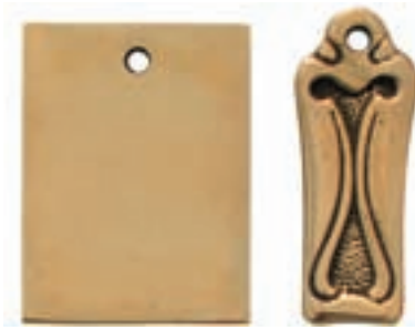
Msp: Messing poliert Fems: Eisen vermessingt