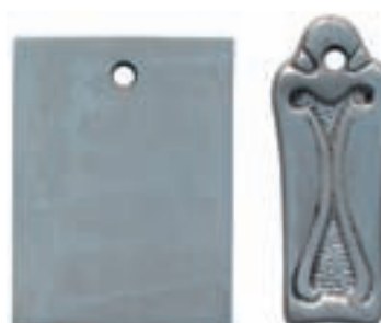
MsNim: Messing matt vernickelt