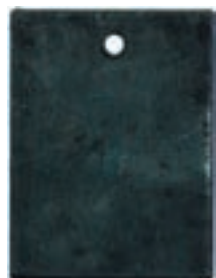
Fea: Eisen alt, auf Wunsch mit gewachster Oberfläche, Öl eingebrannt