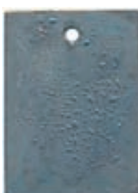
FeZn: Eisen feuerverzinkt