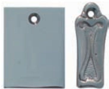
MsNi: Messing vernickelt